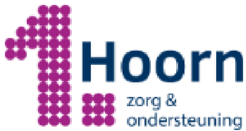
Logo 1. Hoorn, zorg &amp; ondersteuning